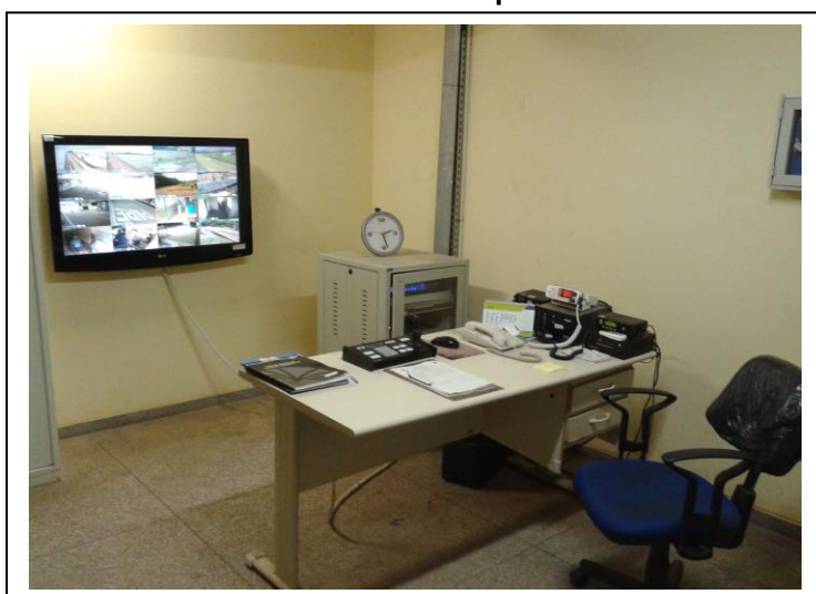
Sala de Monitoramento