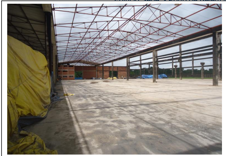
Armazém área Externa

Edifício Sede – Porto de Belém – Terminais de Outeiro e Miramar