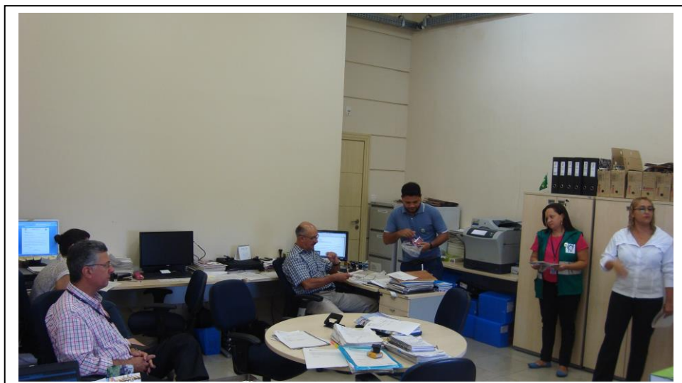
CIPA na GERHUM