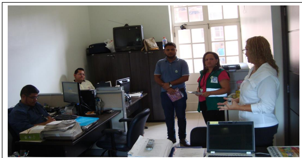
CIPA no SIC