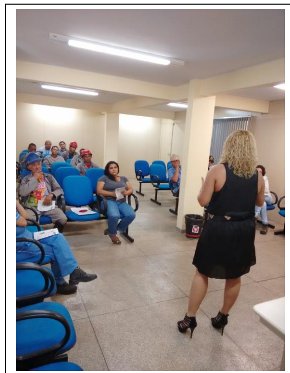
CIPA no Terminal de Outeiro