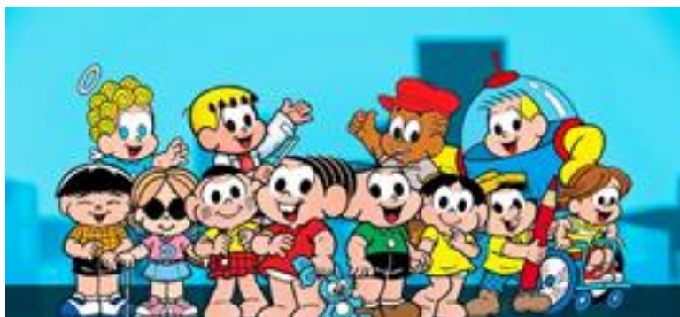
Imagens de divulgação do programa

O Programa Um Por Todos e Todos Por Um! Pela Ética e Cidadania , da Controladoria-Geral da União (CGU), lançou revistas digitais e interativas com a Turma da Mônica sobre ética e cidadania, desenvolvidas para os estudantes dos anos iniciais do ensino fundamental (1º ao 5º ano).